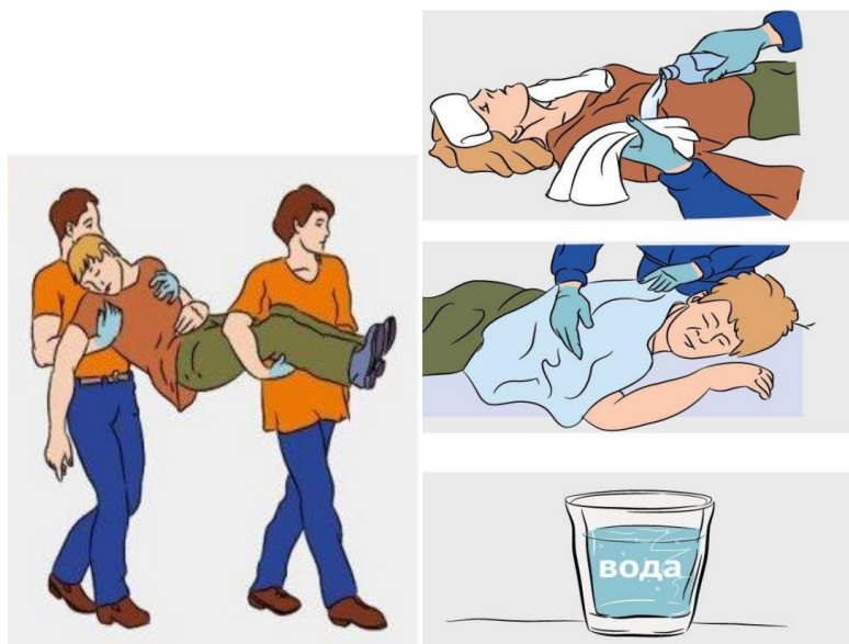
Рисунок 1 – Оказание первой помощи пострадавшему при тепловом ударе

10. Пользуясь рис.1, составьте алгоритм ваших действий по оказанию помощи пострадавшему при тепловом (солнечном) ударе: